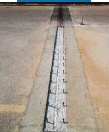
Ремонт пришовной зоны