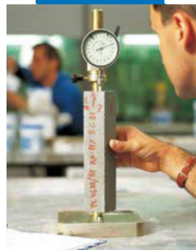
Определение расширения в стесненных условиях