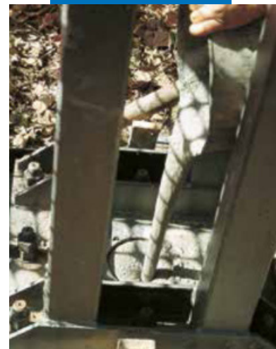
Анкерное крепление с помощью раствора Mapefill