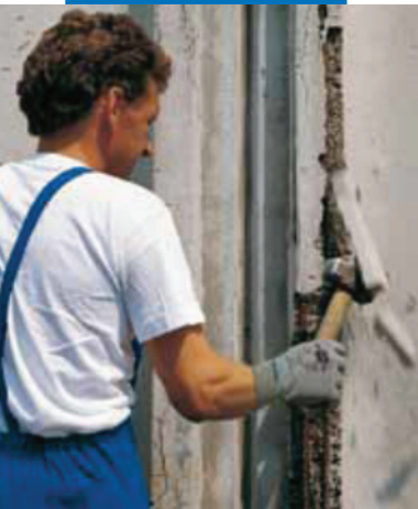
Удаление поврежденного бетона