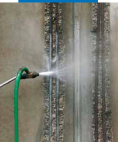
Очистка стальной арматуры