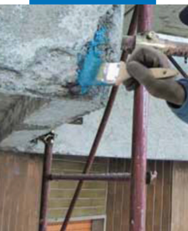
Нанесение Mapefer 1K кистью на арматуру балкона