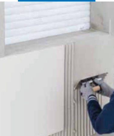
Установка крупногабаритной керамической плитки

При смешивании с водой этот состав становится раствором, обладающим следующими характеристиками: