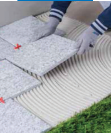
Укладка натурального камня в экстерьере