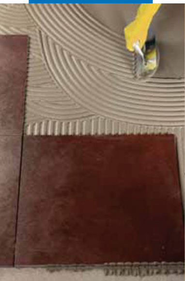
Укладка керамической плитки на стену