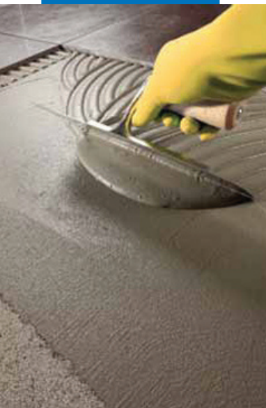
Укладка плитки на Kerabond T-R на пол