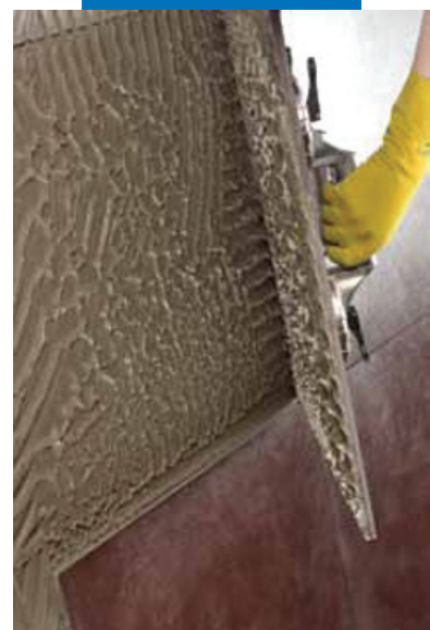
Необходимо смачивать 100% обратной стороны плитки при укладке крупноформатного гранита