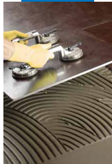
Укладка крупноформатного керамогранита на Kerabond T-R замешанный с Isolastic

Прим.: технические данные клея Kerabond T-R , затворенного на латексной добавке Isolastic , приведены в технической спецификации Isolastic .