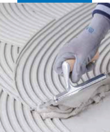
Укладка плитки ординарного обжига в качестве стенового покрытия поверх гипсовых панелей