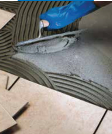
Укладка плитки ординарного обжига в качестве напольного покрытия